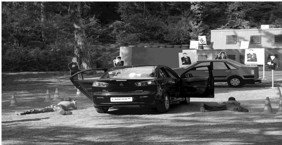
Вариант стрельбы из-за автомобиля